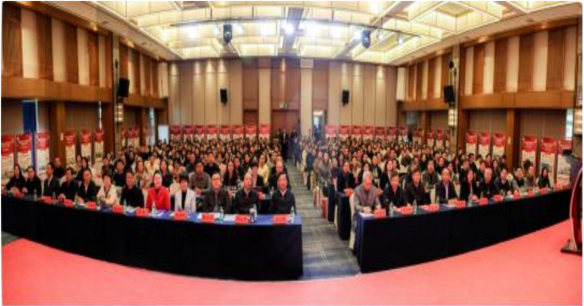
图 1 金职伟业集团有限公司与长沙民政职业技术学院等联合承办 2024 年全国婴幼儿照护服务行业产教融合共同体年会

会，来自全国各行业协会、本科院校、中高职院校、企业的 400 余名代表共同参会。一年来，成员发展到 600 多家。