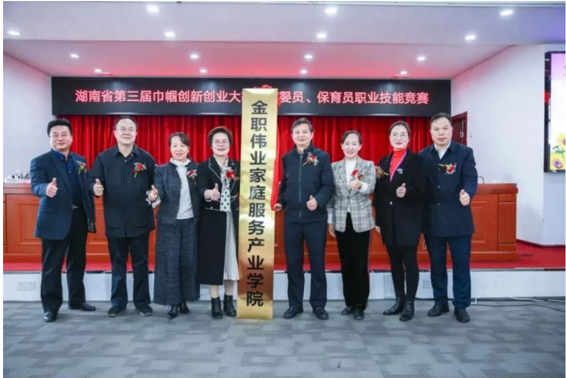
图 2 金职伟业集团有限公司与长沙民政职业技术学院共建 金职伟业家庭服务产业学院揭牌