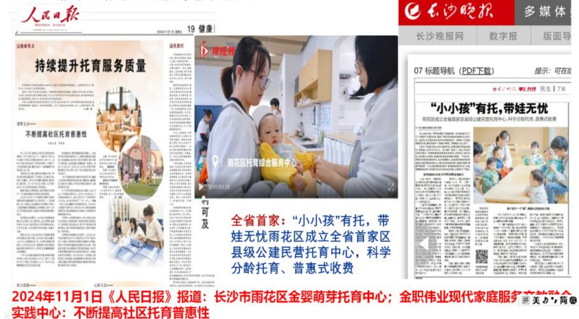
图 5 《人民日报》《长沙晚报》等报道校企合作办学成果