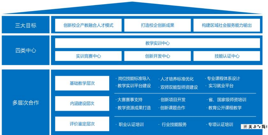
图 3 现代家庭产业学院建设框架